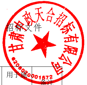
拟投入本工程的主要施工设备表